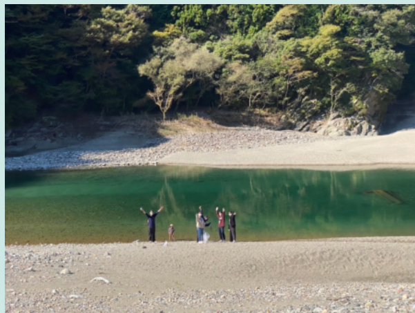
上：豆こぼしクリーン大作戦にて

私も幼少期外で遊ぶことはありましたが、近所の川に遊びに行く！という経験をしたことがないので佐久間町の子供達がとても羨ましいと思いました。