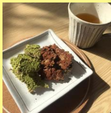
抹茶&ココア で甘い味付け にしました😊

2年生2人と1年生1人の3人でごまちゃんづくりをしました！1年生は初めての作業、2年生も久々のごまちゃんづくりということで、最初は探り探り作業を進めていましたが、パンプキンレディースさんと教えていただいたことを思い出しながら、徐々にコツを掴み、楽しく作業をすることができました！特にごまと水飴を混ぜ合わせる場所は、素早く混ぜないと固まってしまう、とても力が必要なため、大変でしたが、3人で力を合わせて美味しいごまちゃんを作ることができました！私たちはきな粉の代わりに、抹茶パウダーとココアパウダーを使ったごまちゃんも作ってみました！3人の中では抹茶味が1番人気でした。ぜひ試してみてください！