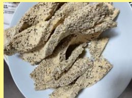
懐かしさ満点 プレーンごまちゃん♪

とても美味しくできました！久しぶりのごまちゃんごまび作りで、初めは戸惑うところややり方がうる覚えのところもありましたがなんとかいつものごまちゃんごまびを作ることが出来ました！きなこの甘い味付けとサクサクした軽さが色んな世代の方に好まれるお菓子だと思います。それと同時に、佐久間のお母さん方が恋しくなりました！早く一緒にごまちゃんごまびを通じて繋がってきたいです。また、チョコランチを入れるなどアレンジもしましたが、やっぱりいつものごまちゃんごまびが1番美味しかったです。